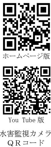
水害監視カメラ QRコード

公開は、7月21日より全てのカメラの配信を始めています。又、配信方法として、ホームページ版とYouTube版がありますので、みなさまのニーズに合ったサイトで状況を確認願います。