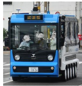
佐賀関のまちなかを颯爽と走るグリーンスローモビリティ

大分市は、新たな移動手段として現在、野津原・植田地域において低速電動バス「グリーンスローモビリティ」の実験運行（令和4年3月31日迄）を行っています。佐賀関地域でも実験運行を行いますので、一足先に試乗してきました。