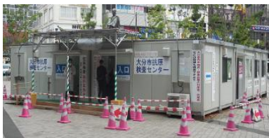
（大分市抗原検査センター）

大分市においても、経路不明者や家族内感染が増えており、飲食店関係や事業所ではクラスターが発生していることから、感染者の早期発見および感染拡大の未然防止を図るため、6月末までを予定していました「抗原検査センター」を9月末迄延長します。