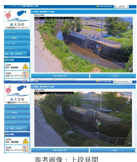
参考画像：上段昼間 下段夜間