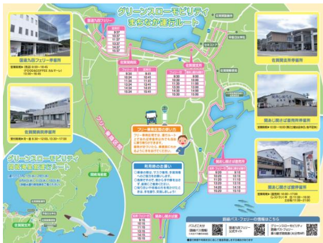
佐賀関地域運行ルート

※グリーンスローモビリティとは 時速20km未満で公道を走ることができる 電動車を活用した小さな移動サービスの事